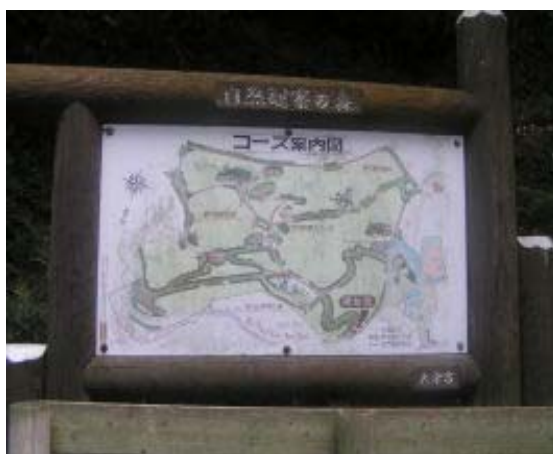
自然観察の森案内図 ④