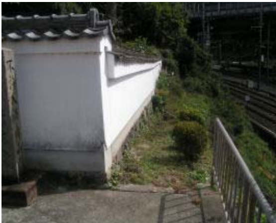
摂取院の右手に下りてくる