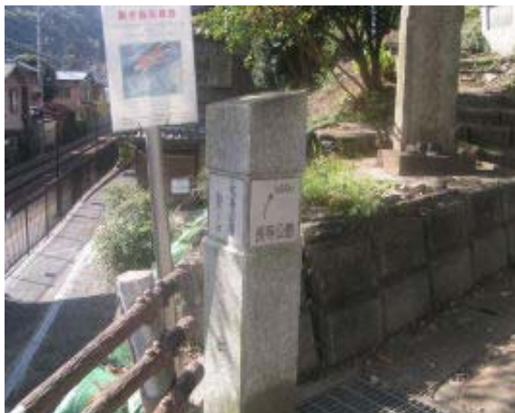
京阪上栄町西側の長等公園標識①

938 上栄町 1008 長等公園・兜大神⑤ 1012 京阪大谷分岐⑥ 1032 京阪追分分岐 ⑦ 1050 菱形基線測点 No30⑧ 1119 摂取 院分岐⑨ 1136 摂取院 1141 京阪追分