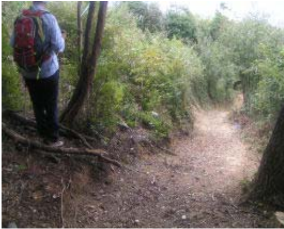
摂取院分岐（巡視路に行く）⑨