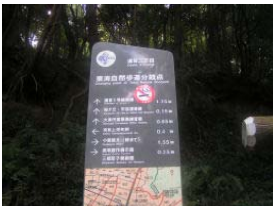
東海自然歩道の案内 ④