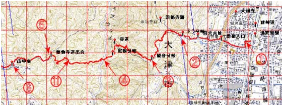
滋賀里から山中町