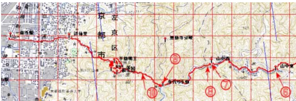
山中町から一乗寺