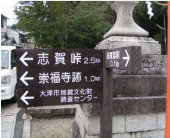
滋賀里駅近辺の標識 ①

938 滋賀里駅 956 志賀峠分岐② 1042 志賀峠④ 1106 無道寺道出合⑤ 1120 山中町東⑥ 1143 山中町西⑦ 1159-1205 身代り不動⑨ 1219 瓜生山東稜線⑩ 1235-1307 瓜生山・昼食 1330-1341 狸谷不動尊 1406 詩仙堂 1419 一乗寺駅