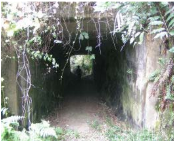
志賀峠 (上部は比叡山ドライブウェイ) ④