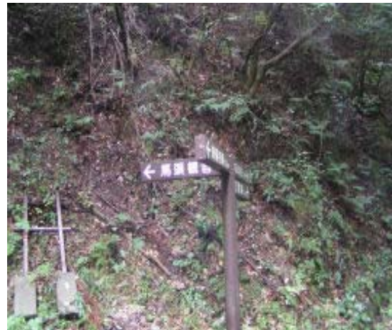
馬頭観音分岐 (南滋賀への道?) ③