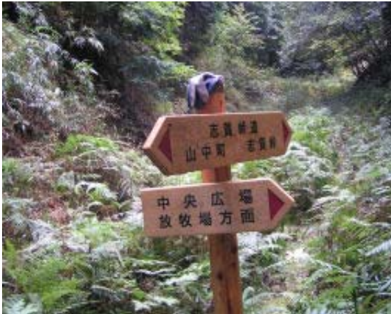
ふれあいの森と志賀峠への標識①