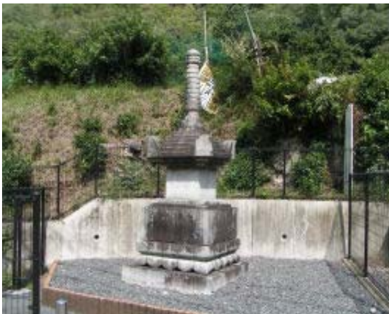
法篋印塔⑦ (山中町を出る手前右)