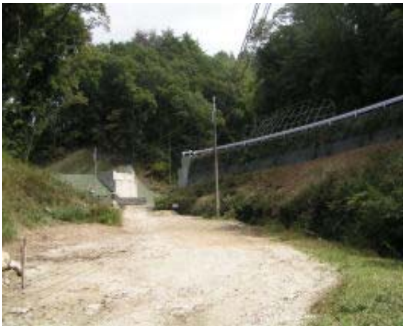
無動寺道に並行して道路をつくっている