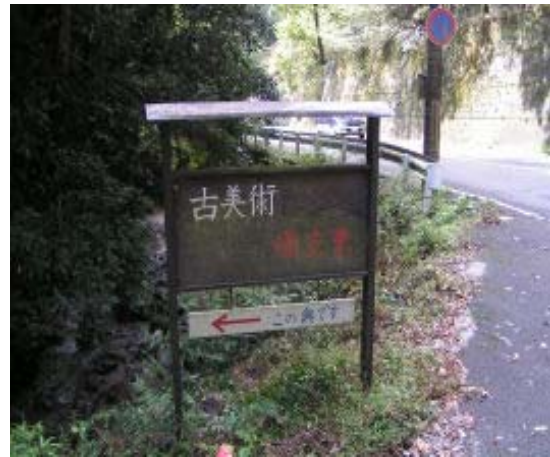
左側の階段を降り旧道にはいり重ね石を見て旧道を進むと再び下鴨大津線に⑧

参考図書のおかげですんなりと瓜生山に到着。もっともいやだったのは車の多い下鴨大津線の15分間の歩き、平日ゆえ少なかったと思うのだが、休日なら大変だろう。