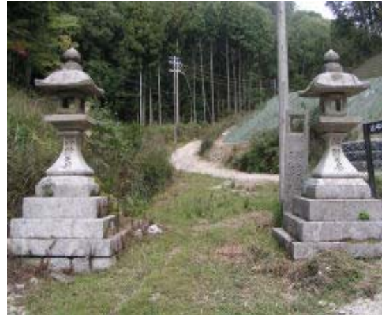
無動寺道との出合⑤