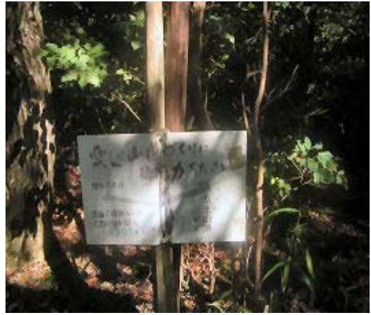
左と同じ場所 (不動尊への道) 592