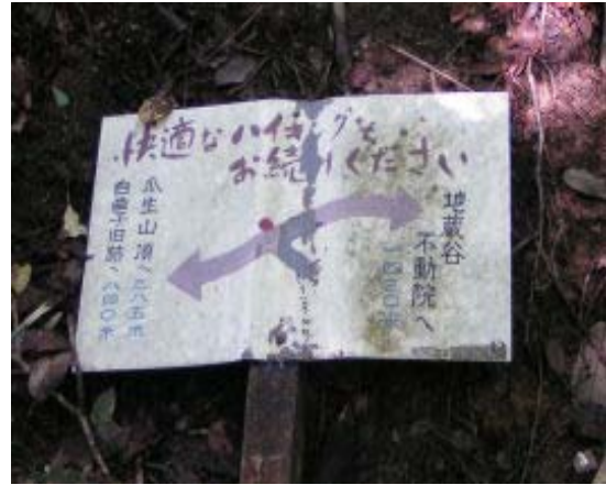
瓜生山の東稜線に取り付いた所⑩