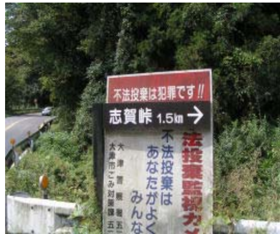
下鴨大津線にある標識⑥