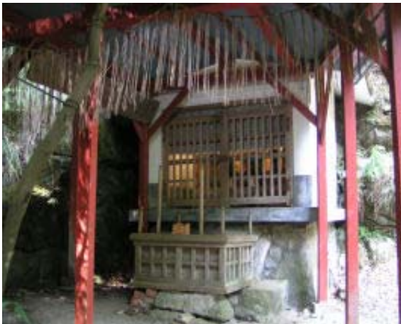
身代わり不動尊上部のお堂の左から瓜生山に