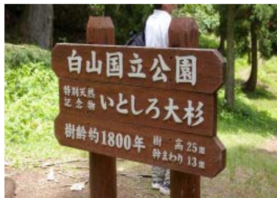
いとしろの大杉 ブナ林を登る