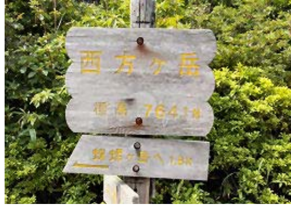
避難小屋のある山頂 ⑥