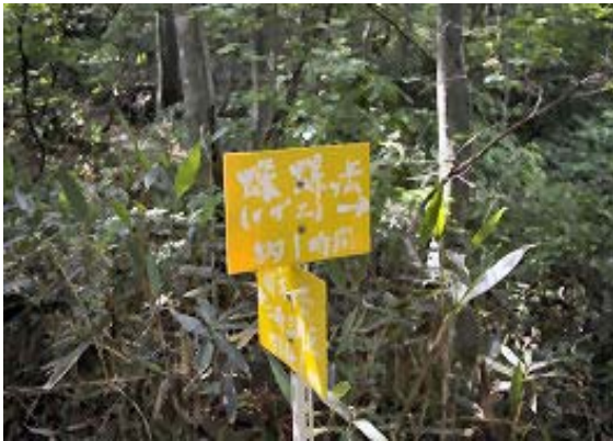
三角点への途中にあるサザエヶ岳への道