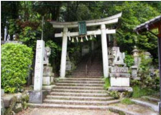
太郎坊入り口 地点⑥