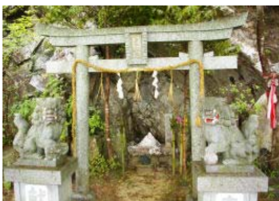
兜岩と岩戸神社 地点②