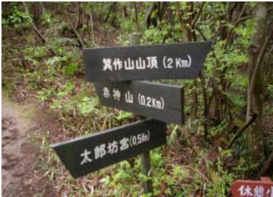
太郎坊山(赤神山)分岐 地点⑤