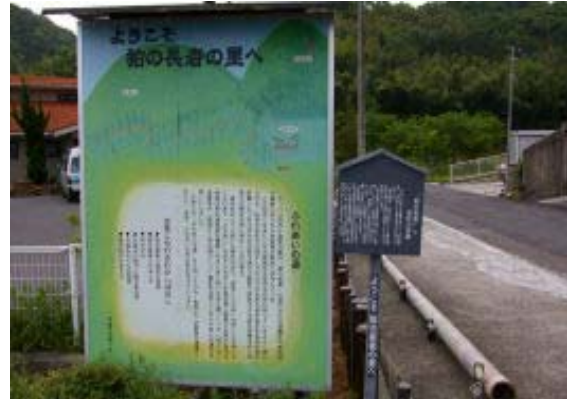
ふれあいの道案内・地点⑦

太郎坊宮は下からみてもりっぱだが、上からみてもりっぱなお宮さんだ。多くのひとが参拝にくるのも納得だ。ふれあいの道から竹林を通過して直接登山口に帰るつもりだったが、タケノコシーズンのためか、道がふさがれており、止む無く池を廻って帰る。