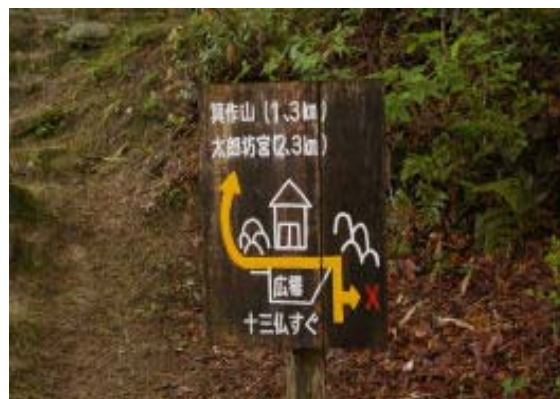
もうすぐ十三仏 地点②