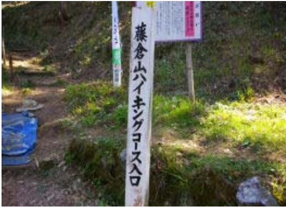
森羅神社にある標識 地点③