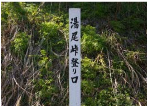
湯尾峠への標識 地点④

コースはよく踏まれており、また、標識も完備しているので、不安はない。湯尾峠から来たおじさんによれば、湯尾峠道はカタクリが多いとのこと。時間があれば行くことにした。鍋倉山の標識がなかったのだが、あとから聞けば、鍋倉西谷への標識の裏にあるとのこと。