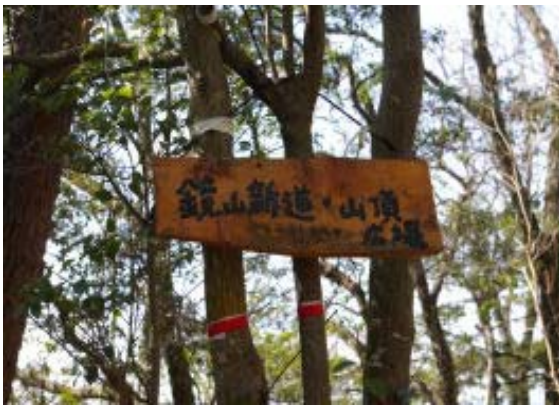
三角点近辺にある新道標識