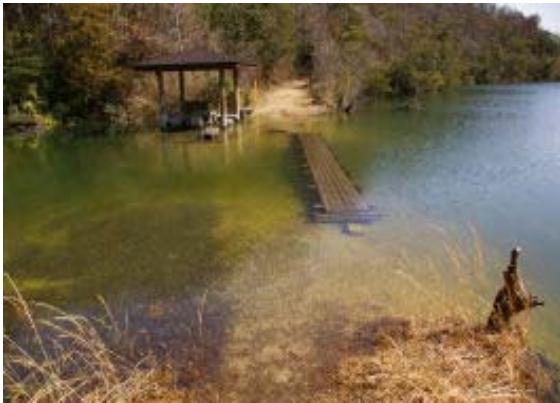
鳴谷池の道が浸水