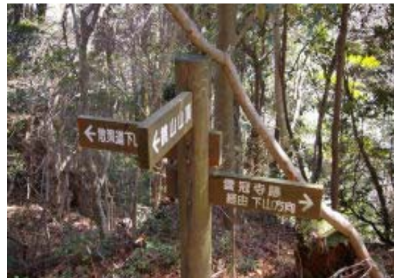
散歩道分岐（寺跡をショートカット?）

三角点への途中に鏡山新道の標識（石の広場の南に降りる道?）、三角点からも展望が悪い。更に西の岩（涼み岩?）からはようやく西にある三上山とその周辺の山をみる事ができた。稜線に道もあり、道の駅方面にも行けそうだ。昼食を済ませ、雲冠寺跡に向かう。寺跡あたりは道が荒れ、ぬかるんでいた。三尊石仏を拝み、石の広場、山頂?の道を経て、鳴谷池に到着。池の水量が多いためか道が浸水し、迂回路に。希望ヶ丘への分岐を過ぎると、鳴谷溪谷だ。竜王八景のひとつ、「鳴谷の石床と清流」の場所。