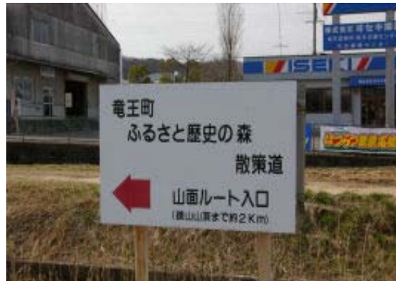
車道にある山面ルート標識

国道沿いの沈砂池あたりは工事中であり、道が幾分わかりにくい。立ち入り禁止の看板に従い、柵の間を行けば国道だ。適当なバスはなく、道の駅まで1Hrの歩き。