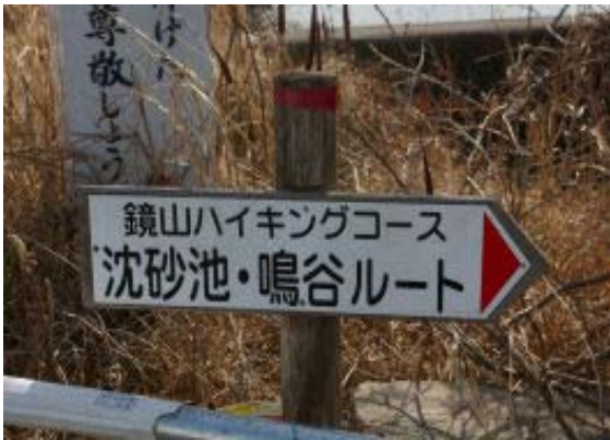
国道にある鳴谷ルート標識