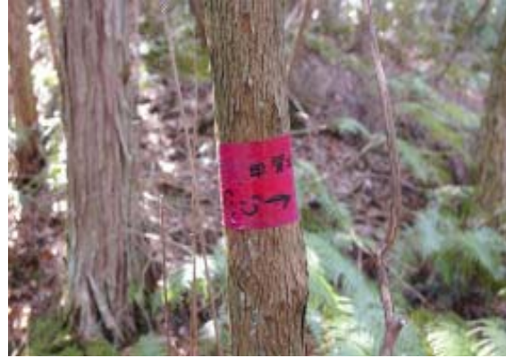
山頂への道？ 鏡山新道？