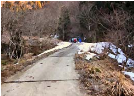
凍結のため、林道途中で車ストップ 林道分岐の標識・地点①