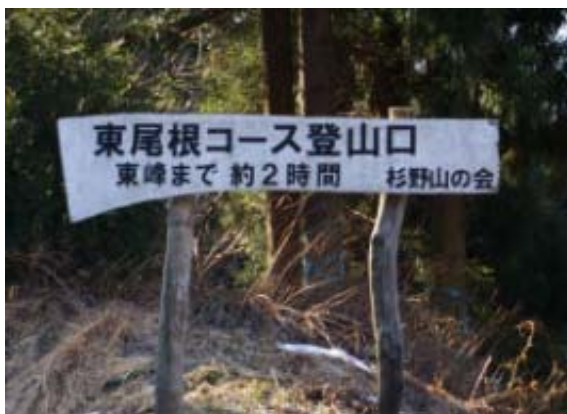
東尾根登山口・地点②

933 駐車地点 954 東尾根登山口 1003 東尾根・地点③ 1116 東尾根・地点⑤ 1219-1328 東峰 1353-1408 西峰 1416 西尾根ピストン 1457-1508 東峰 1619 駐車地点