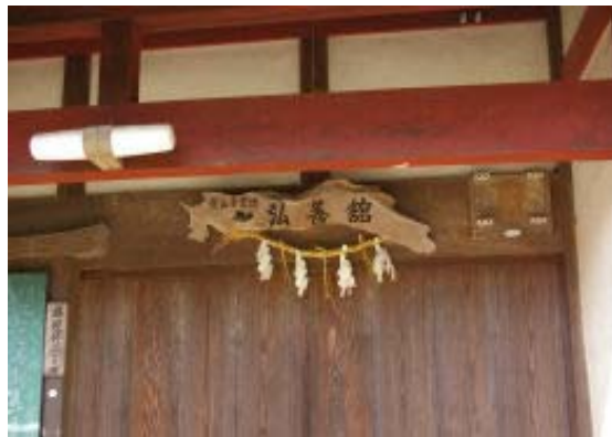
弘善館（閉鎖中—駐車可）