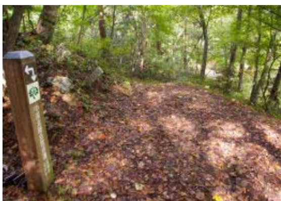
一周コースの分岐は左へ (地図②)