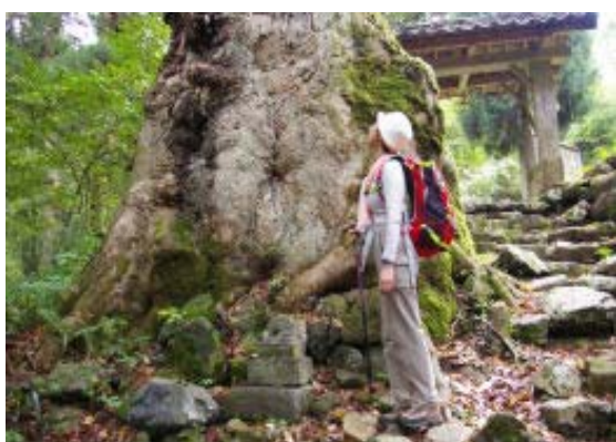
山門のケヤキ (地図③)