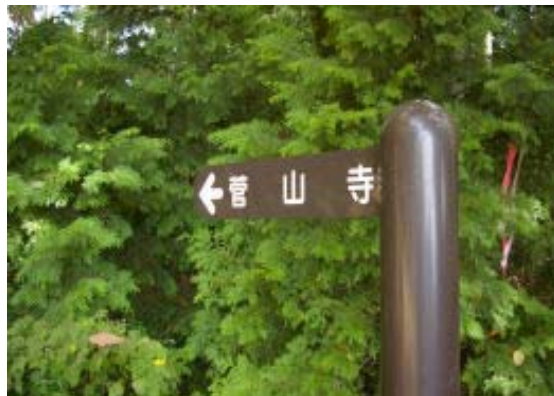
菅山寺への標識 (地図①)