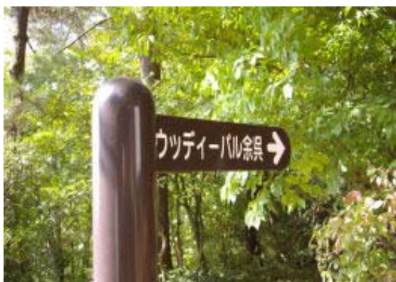
ウツディパルへの分岐 (地図①)