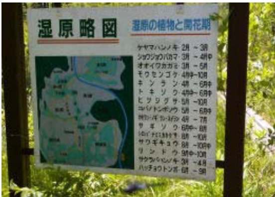
山室湿原の案内図

五色の滝は大きい。上ろうとしたが、すべるので断念。きれいな水ではなかったが、ここで「流さないそうめん」を食べる。