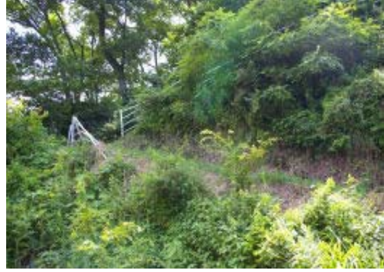
堰堤手前の登山道（標識なし）