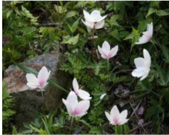
大きなイチリンソウ