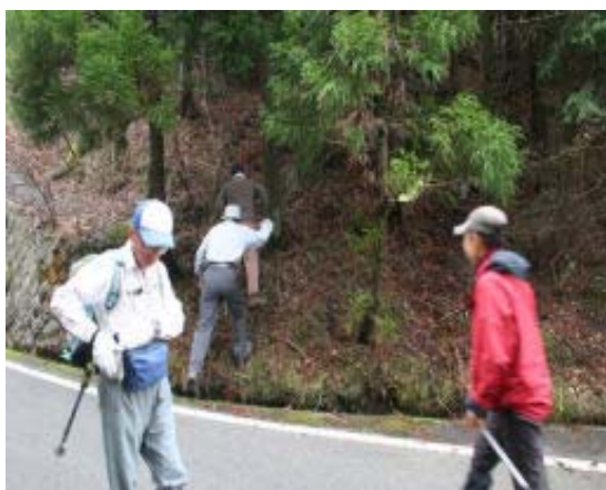
421号ミズナシ登山口