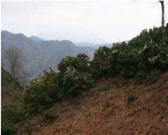
太尾手前のアセビ群落