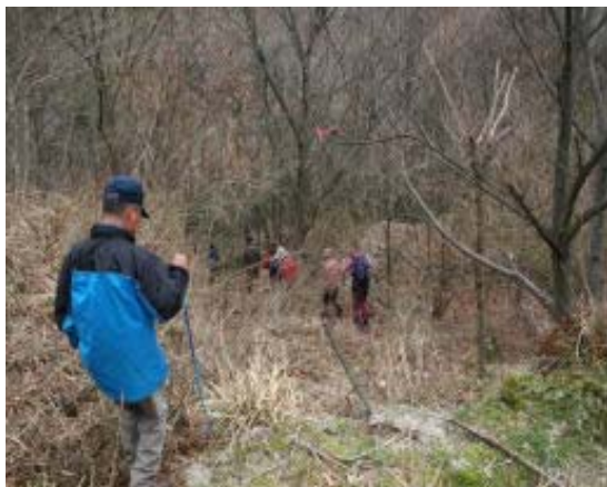
太尾登山口 (古語録谷への下り)

1432 尾根分岐 1515 P533 1527 茶屋川林道 (ヘリポート) 1609 ミ ズナシ下山口 (車駐車)