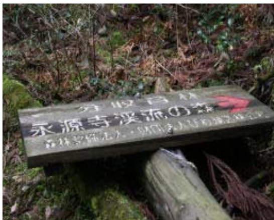
ミズナシの下山口 (永源寺溪流の森)