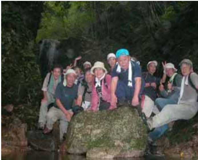
左後方がまぼろしの滝 Yさんの三脚なしカメラで全員の記念撮影