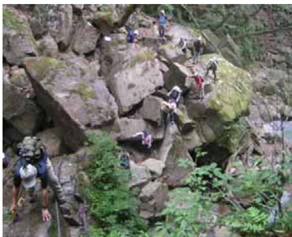
大きな岩を越え、大播鉢を目指す

今回は京都比良山岳会の行事に便乗、魚止からまぼろしの滝を目指す。魚止の滝から空戸の滝まで行ったことはあるはずだが、全く覚えておらず、大きな岩と登りと滝に改めて感激する。やはり、ここを通らないともったいないな。