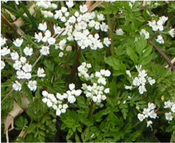
白い小さな花 いずれも名前は？