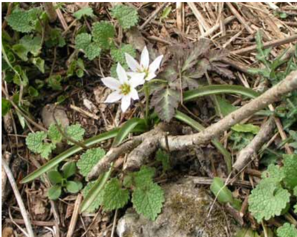
ヒロハアマナ ハシリドコロ