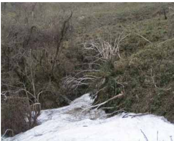
樹皮のない樹木 ヒトリシズカ