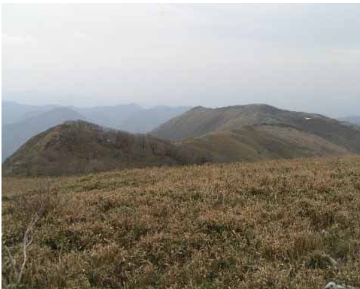
最高点より近江展望台（中央）