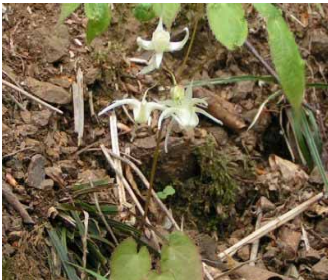
トキワイカリソウ

8時滋賀坂本発 9:30 今畑 9:45 発 12時近江展望台昼食 13:45 最高点 15時5合見晴らし 15:35 汗拭き峠 16:15 今畑 18時帰宅