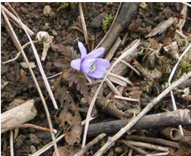
キクザキイチリンソウ

帰り道の福寿草は寒さゆえ、いっそう一層花が小さくなっていた。8合からは花はほとんどなかったと記憶。この時期の鈴鹿は初めてだが、靴はどろどろであった。雪解けと雨のせいか道はまさにドロコ道。もっと、早い時期なら、8合までに福寿草に出会え、8合ではセリバオウレンの群落にも会えたであろうに。