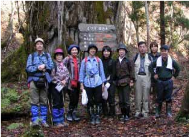
カツラの大木の前での記念撮影

次の目的地は栃の木と杉の保存林。ありました。これもりっぱです。栃の木は上谷のそれより小さめでした。杉は結構大きい。ここで昼食とした。久しぶりにガスを持ってきたので暖かいラーメンを食べることができた。ドリップコーヒーやデザート付きのデラックスな昼食でした。