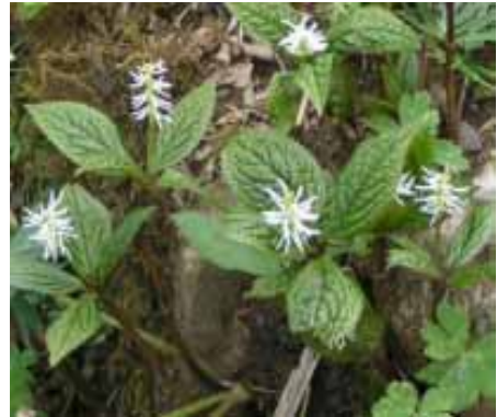
山頂にてヒトリシズカ 山頂での休憩