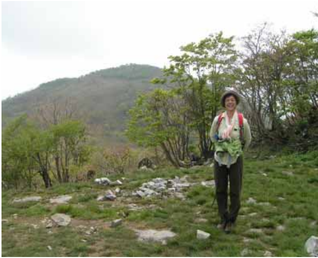
小屋から藤原山頂を撮る