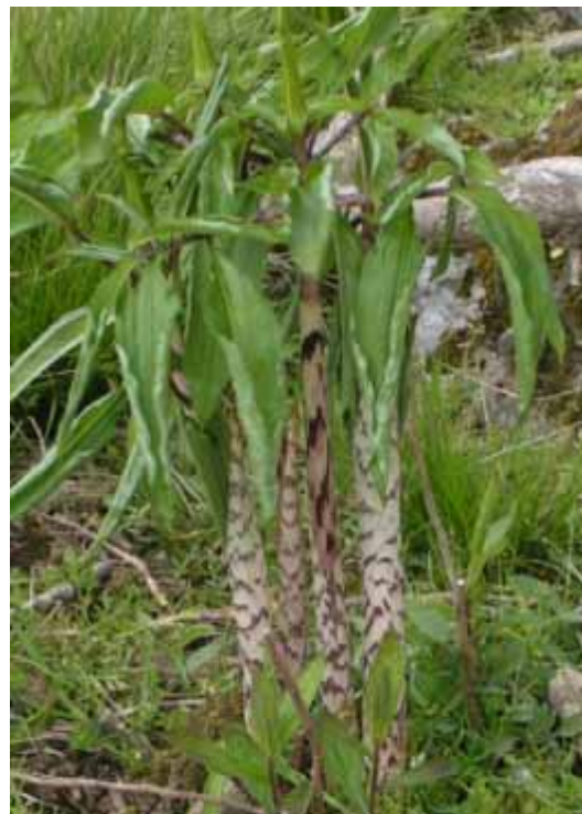
マムシグサ (小屋と山頂の間)

9合から小屋までは結構長くこれまでの合表示で2合分要す。山頂までさらに20分くらい。よって、気分的には13合で山頂となる。残念ながらかすんでいて、景色はよくないが、360度の展望であることはたしか。天狗岩もかすみのなかにうっすら。景色がいまいち、なので帰ることにした。