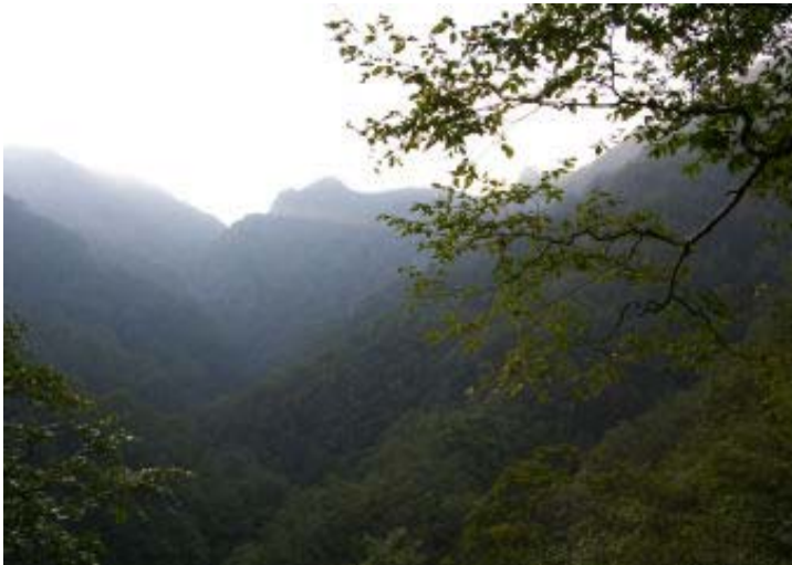
ガスの晴れ間の夜叉壁

下りは景色や花の写真を撮りながら、ルンルン気分であった。紅葉時期にも来たいが、混雑することなので、無理かな。この夜叉ヶ池は福井側からも岐阜側からもそれぞれ特徴があり、いいところです。