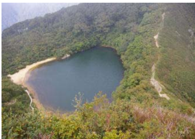
夜叉丸からの下りでガスのない池と 対面

先週末の穂高でどうも膝を痛めたよ うだが、階段の上り下りに不安がない ことからこの企画に参加。常連が4人 とこじんまりとしたパーティとなっ た。去年同じ時期に三周ヶ岳に行っ ており、お花との再開も楽しみにしてい た。