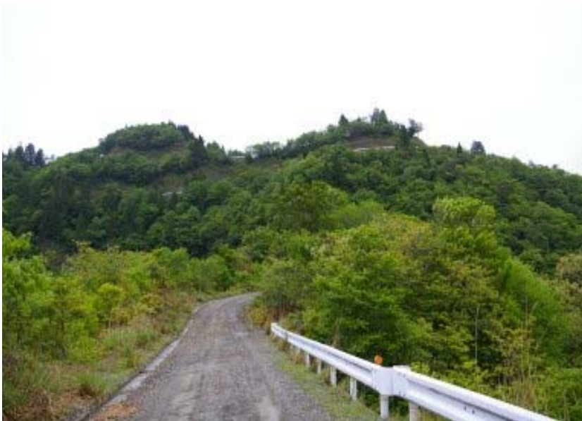
根来坂峠からの下りの林道からおにゅう峠方面を望む

小入谷橋をわたり、小入谷越Pに向かう。天気のせいかわれはあまりなかった。遠景を楽しめなかったのが、晴れた百里に再チャレンジしたいと思う。