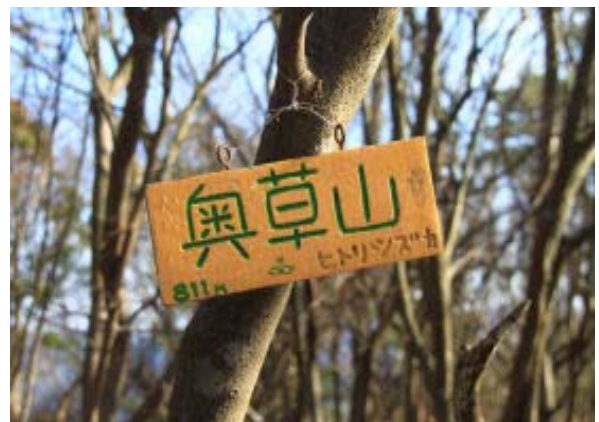
奥草山⑨ (P811 ではなく 830mくらい)