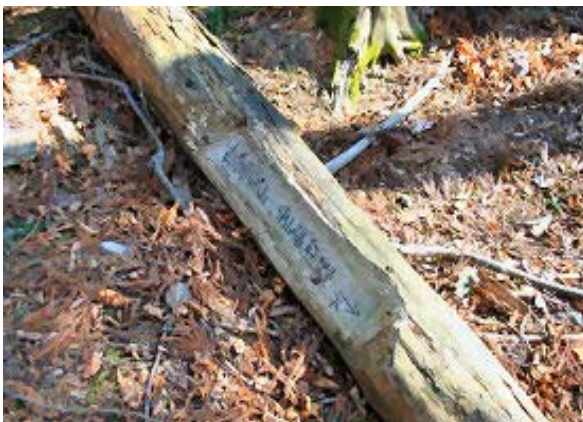
熊野峠 (塩の道峠) ⑦