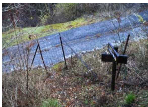
しばらく進むとまた、入口