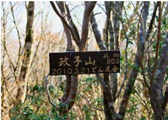
政子⑩ (南東に少し行くと展望所) 奥草山からP537を経て林道と合流。 綿向-奥草-政子という綿向の南側の縦走でした。