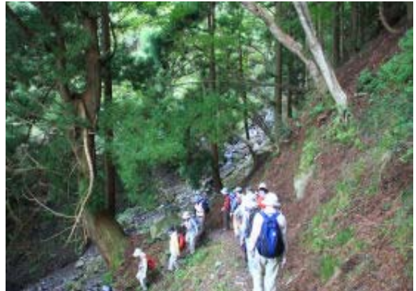
もうすぐ薬師の滝