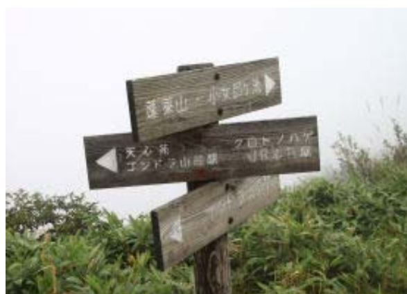
クトノハゲ 標識 ②