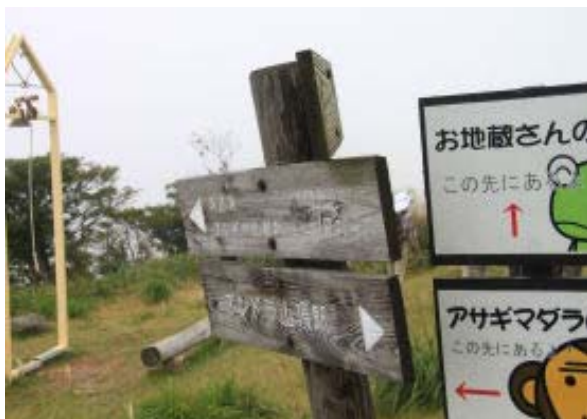
山頂そばのクトノハゲ 標識①

950 山頂駅 1032-1101 蓬莱山山頂 1205-1306 小女郎ヶ池 1521-1546 薬師 の滝 1621 福谷の里石碑④