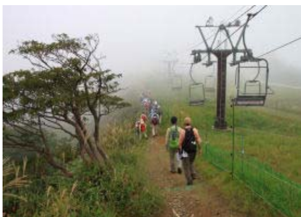
ガスの中、蓬莱に向かう

950 山頂駅 1032-1101 蓬莱山山頂 1205-1306 小女郎ヶ池 1521-1546 薬師 の滝 1621 福谷の里石碑④