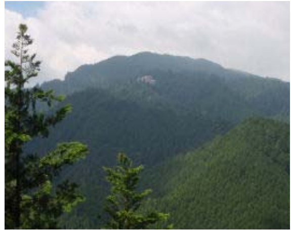
ベンチもあり見晴（山頂）もよい③