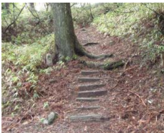
林道ショートカット①

825 飯室不動 913 林道出合 (飯室分岐) 940 三石分岐 955 林道分岐 (林3) 959-1015 林道行き止り③・昼食 1021-1034 林道分岐 (足洗分岐—④) 1040 神宮寺分岐 1059 地点⑤ 1110 地点⑥ 1136 日吉大社