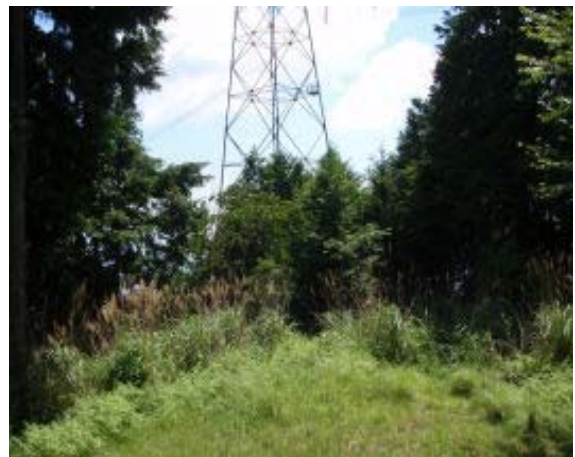
行き止り④ （巡視路は右の林道から）