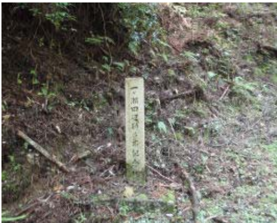
大宮林道から本坂に ⑤