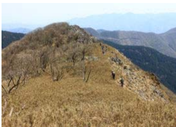
最高点から岩ノ峰②を振り返る

922 岩ノ峰取付広場① 1025 岩ノ峰② 1051 最高点 1108 経塚山 1132 四丁横 崖④ 1146 谷山 1207-1231 昼食⑤ 1402 P 746 直下 1509 P 695 1622 五僧峠 1652 白谷林道分岐 1750? 安原