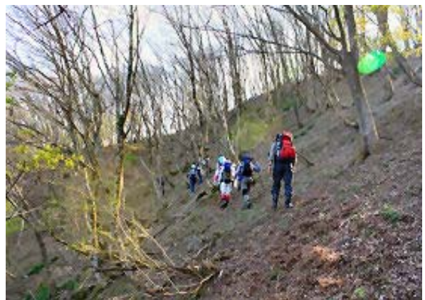
P656 を巻いて五僧峠に向かう ⑥