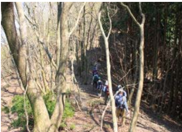
県境稜線 (滋賀県・植林、岐阜県・自然林)