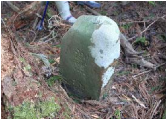
測点 ⑦ (100418 の測点と対)