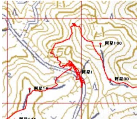
今回のルートⅢ・畜産団地北で林道横断