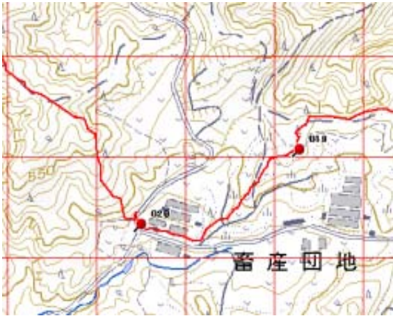
KさんルートⅡ・畜産団地付近で林道横断