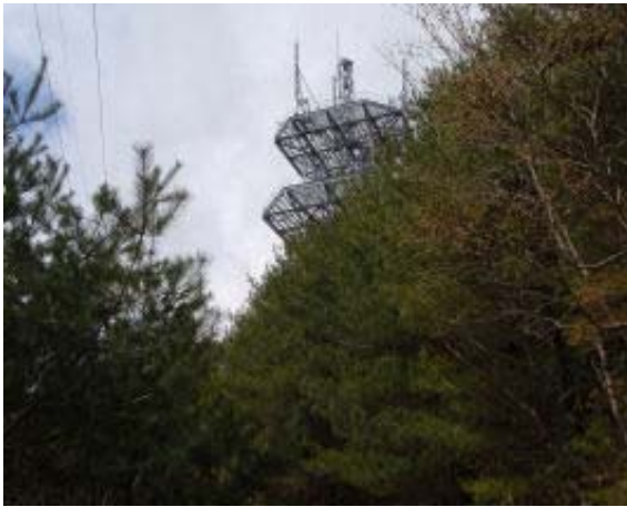
大納言・無線中継所