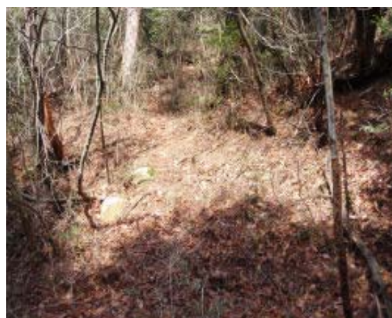
峠にはかすかな踏み跡が横断