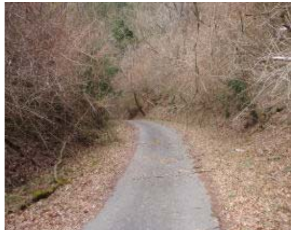
畜産団地前の林道 ⑩

さて、計画では三大寺から飯道山であったが、車のルートでミスがあり、飯道神社駐車場からのルートに変更。下見はしてあるのでルート変更は自信もってできる？。神社駐車場からのルートは 100314 を参照ください。