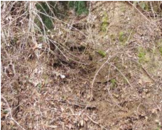
峠・地点⑩にはかすかな踏み跡