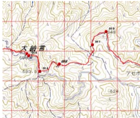
Kさんルート I ・大納言手前