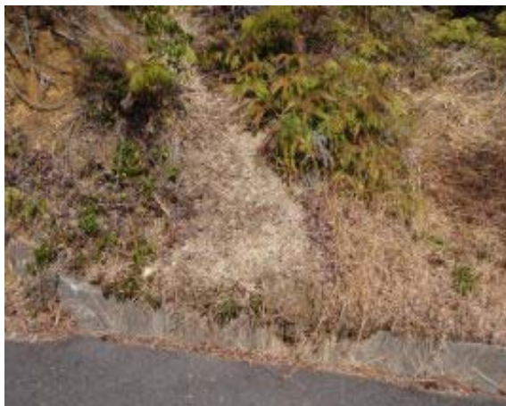
標識のない登山口

1002 登山口 1017 縦走路合流(鶏冠と天狗岩の間の鞍部) 1045 山頂 1105 縦走路からの分岐 1112 登山口