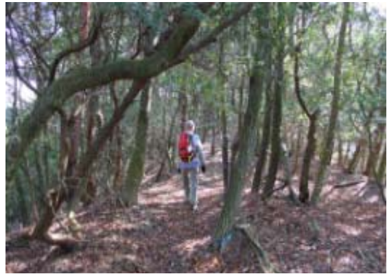
南東稜線にはいる